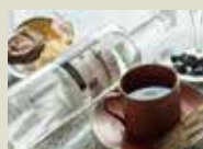
1 札幌 「9148 #0101 STANDARD」