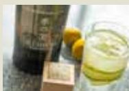
4 京都 「季の美 京都ドライジン」