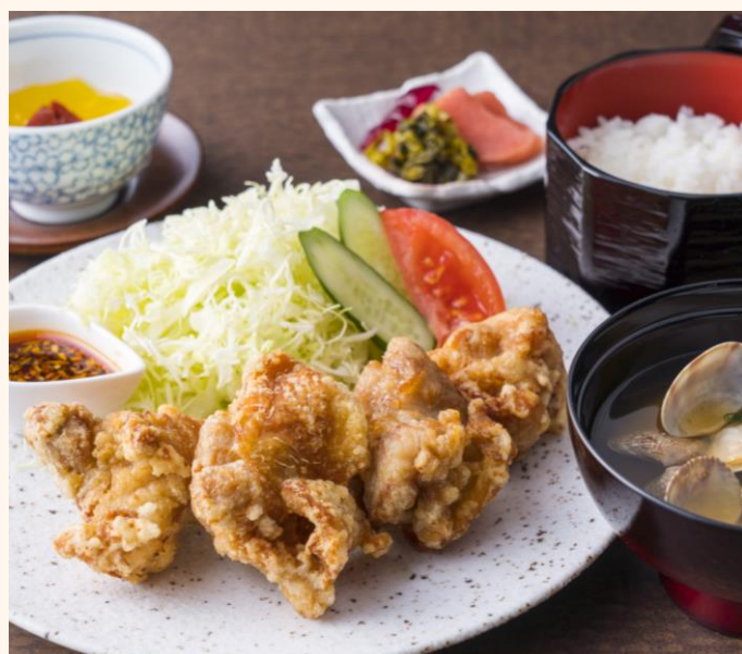
鶏のから揚げご膳