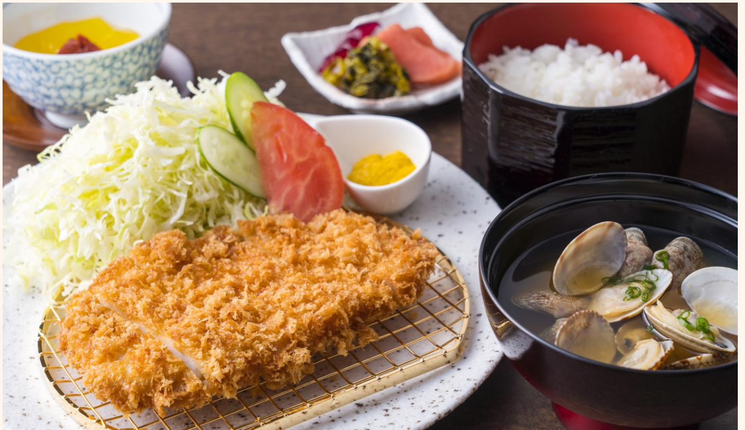
三元豚ロースかつご膳 ¥2,500