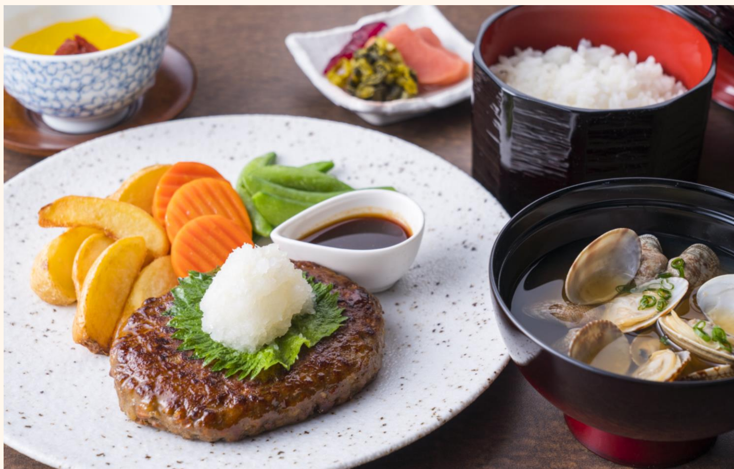
和風ハンバーグご膳