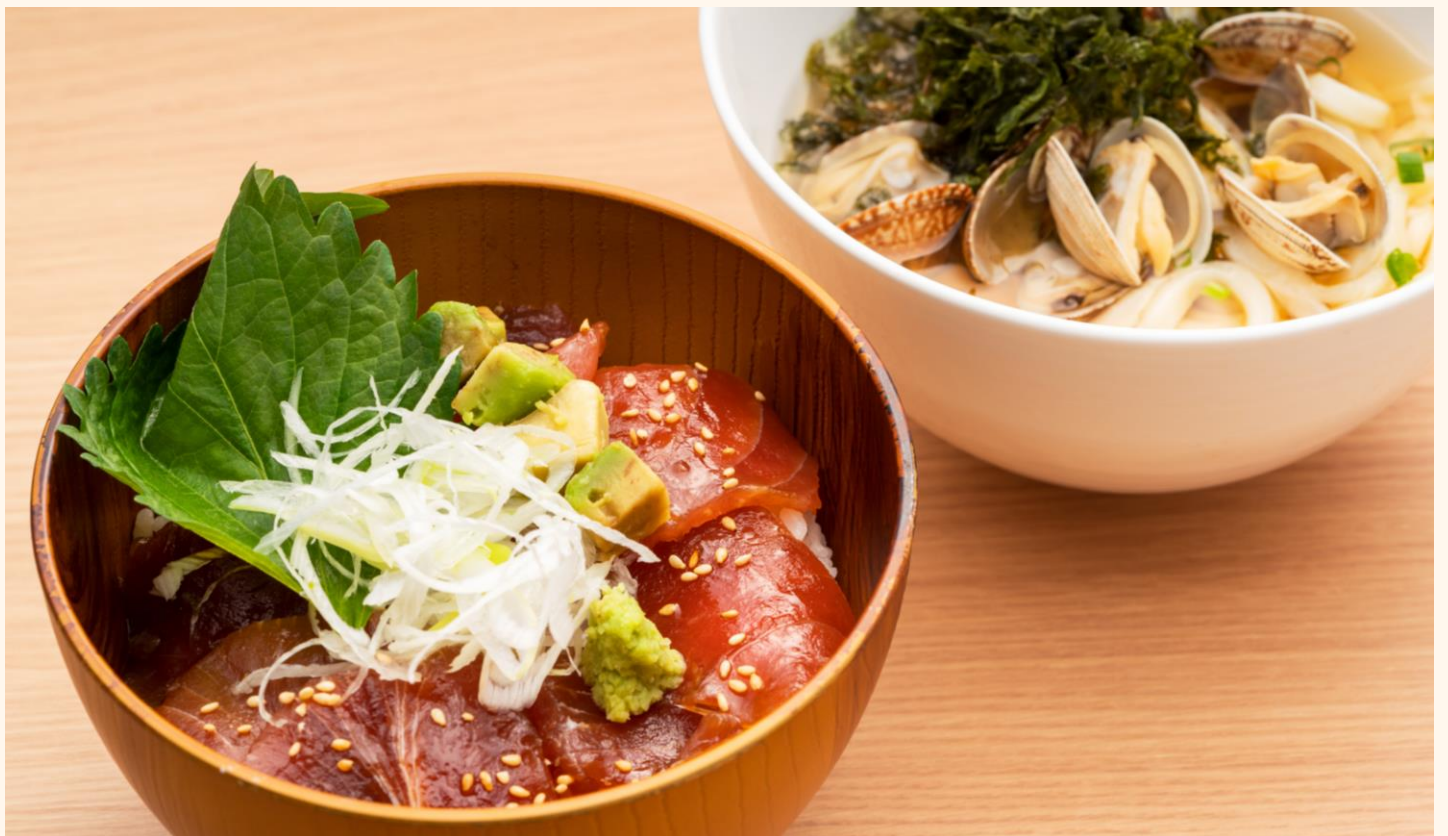
マグロ漬け丼&あさりうどんセット ¥2,800

Marinated tuna sashimi bowl & Clam ramen