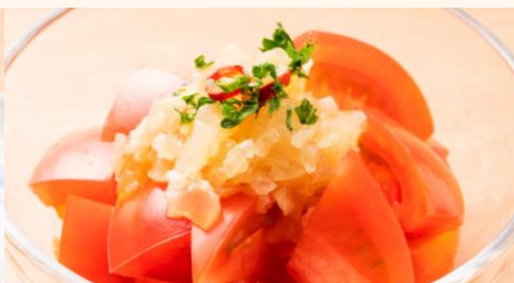
ピリ辛ニンニクトマト